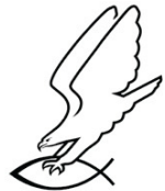
Symbol der „...Germanischen Glaubens-Gemeinschaft“ von Neonazi Jürgen Rieger