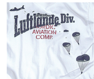
„T-Shirt „Luftlande Div.“