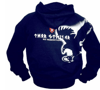
„Kapuzenpulli „No Inquisition“