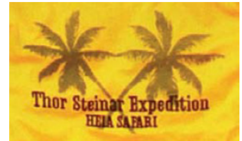
„T-Shirt „Heia Safari“

(...“Und mit glücklichen Augen schaut Bimbo in Eurobi, Es hallt frohes Negerlachen von Biktum bis Nairobi Wenn durch die Savanne unsere Schutztruppen ziehen, Afrika hat wieder Kolonien, Afrika hat deutsche Kolonien, „Heia Safari“)