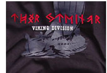
„Thor Steinar Motiv: Viking-Division“