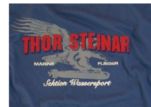
„T-Shirt „Sektion Wassersport“