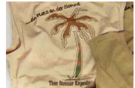
„T-Shirt „Platz an der Sonne“

Teilzitat des Reichskanzlers Bernhard von Bülow. Er prägte diese Worte in einer Reichstagsdebatte am 6.12.1897 „... wir wollen niemand in den Schatten stellen, aber wir verlangen auch unseren Platz an der Sonne “. Seitdem ist sie zur zutreffendsten und einprägsamsten Formel für das deutsche Weltmachtstreben in der Zeit vor dem I. Weltkrieg geworden.